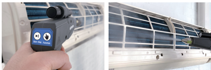
Pistolet de pulvérisation intelligent avec commandes à distance